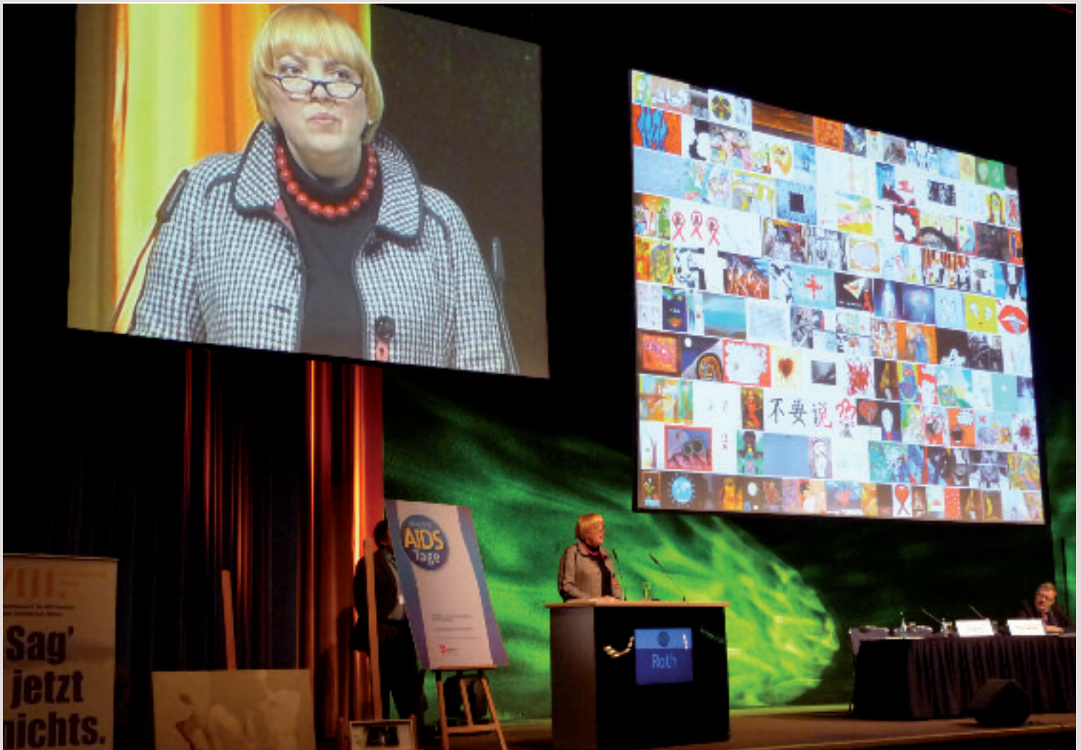
Der diesjährige Konrad-Lutz-Preis stand unter dem Motto „Sag jetzt nichts“ und wurde von Claudia Roth, Vorsitzende von Bündnis 90/Die Grünen, verliehen.